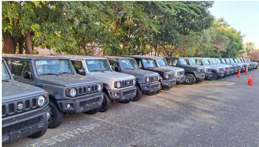
Fuente de datos: División de Comunicaciones y Flotilla Vehicular, incorporadas a las labores de tránsito interno de animales.